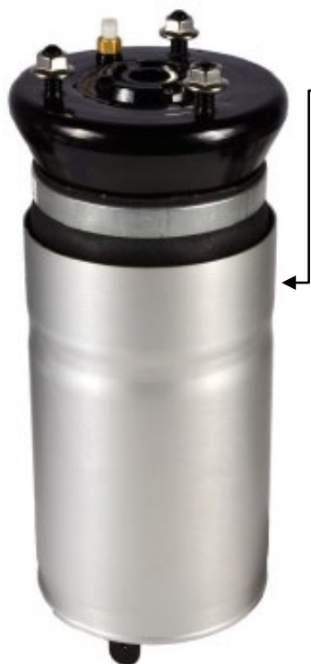
5. 1x Moduł poduszki pneumatycznej